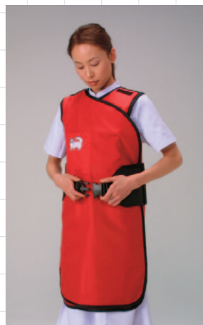
肩を上げながらベルトを装着します