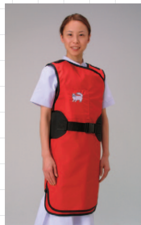
着心地を確認し装着完了