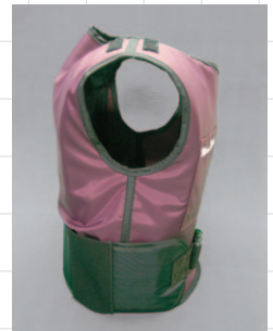
サポートフレーム入り