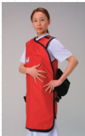
左右しっかりと覆います