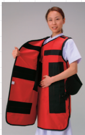
身頃を腋下に合わせます