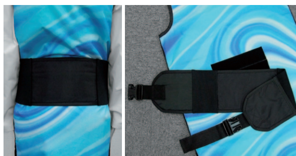
ワイドなゴム付ベルトはベルクロ仕様で腰位置の調節が可能