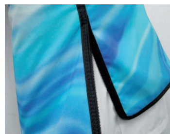
サイドシームはベルクロ仕様